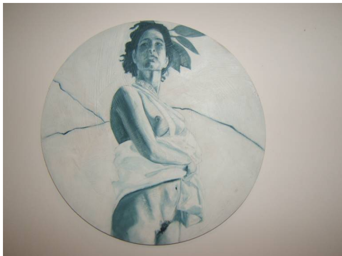
אלכסנדרה - עיגול גריזאי

זהו עולם של נשים בראשותה של הקיסרית אלכסנדרה, תאומתו הפיקטיבית של אלכסנדר מוקדון המבליח גם הוא לרגע בחלל. אלכסנדרה חוזרת בגרסאות שונות במהלך התערוכה, מחליפה את צבע שיערה, את מלבושה, את האטריבוטים אותם היא אוחזת ולבסוף - את הבעתה. לעתים מנצחת, זקופה ובטוחה, לעתים מושפלת, כפופה ומאוימת. לעתים לבד ולעתים עם בנות לווייתה החוזרות ממסע המלחמה או הצייד.